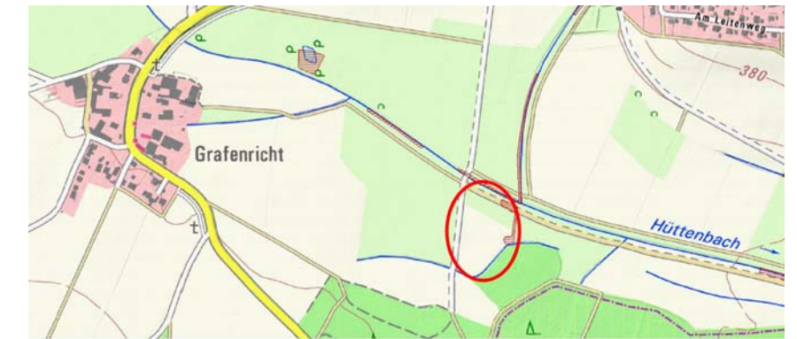
Lage östlich Grafenricht

Umsetzung nach Absprache mit Naturschutzbehörde und Wasserwirtschaftsamt